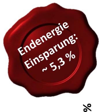
Energieeffizienz-Fortschritt EEI3 [%]